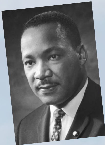
MARTIN LUTHER KING - FICHE D'IDENTITÉ

ÉTAPE 1 — Qui est Martin Luther King ? Remplissage d'une fiche d'identité à partir d'informations sur Vikidia